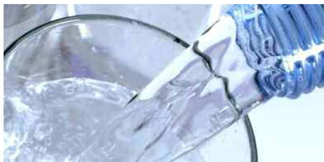
Herkulane: Ein „erfrischender“ Unternehmenskauf mit grenzüberschreitendem Kapitaleinsatz

Eine der besonderen Herausforderungen bei der Abwicklung von Mezzaninfianzierungen bestehe, so Hechl, in der Ausgestaltung der für derartige Transaktionen relevanten Warrants. Während im angloamerikanischen Recht die finanzierte Gesellschaft selbst darüber entscheiden könne, in welcher Form das erhöhte Risiko des Mezzaninkapitalgebers abgesi-