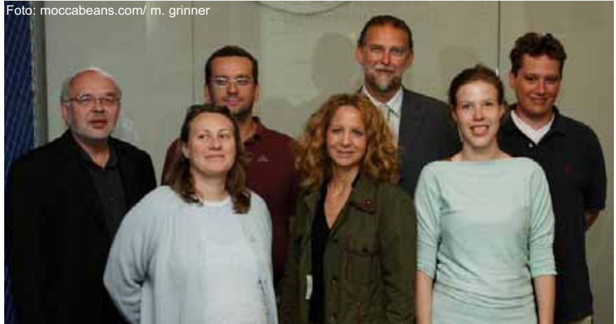
Die Jury der Big Brother Awards 2006 hat viele Nominierungen gesichtet.