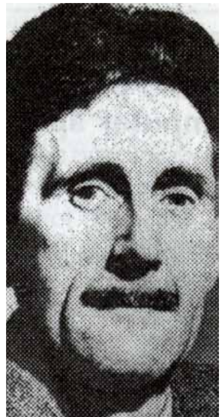
George Orwell: Zeitkritiker bis heute.

Mit dem Beschluß der so genannten „Data Retention“-Richtlinie (übersetzt für „Daten-Zurückhaltung“ bzw. „Daten-Vorratsspeicherung“) hat der Europarat einen „Großen Bruder“ geschaffen, den die Welt seit dem Ende der Sowjetdiktatur für tot und begraben gehalten hat. Aber Totgeglaubte leben offenbar wirklich länger - und nun ist ein System auferstanden, in dem die Wege, Kontakte und Interessen jedes EU-Bürgers erfaßt, abgespeichert und bei Bedarf miteinander verknüpft werden können: Wer hat wann mit wem von wo aus telefoniert, wer hat wem ein E-