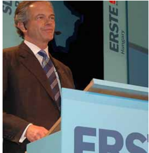
Erste Bank-Chef Treichl bei der Roadshow für die Kapitalerhöhung über 3 Mrd. Euro

An der IPO-Front war die Emission der Post ein durchschlagender Erfolg. Die Aktie hat vor allem mit ihrer starken Performance überrascht (IPO-Preis 19 Euro, Höchstkurs bislang: 39,5 Euro). Das hätte dem ehemaligen Monopolisten wohl kaum ein Marktteilnehmer zugetraut.