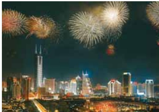
Fonds 2006: Ein chinesisches Feuerwerk

Das nun zu Ende gehende Jahr kann für Fondsanleger sehr erfolgreich gewesen sein - vorausgesetzt, man hat auf das richtige Pferd gesetzt. Neuerlich galt auch für 2006: Aktienfonds sind unschlagbar. Aber es war auch richtiges Engagement Grundvoraussetzung. Sämtliche Performance-Listen sind auf Jahressicht tiefrot - wenn man die chinesische Flagge zu den Top-Fonds stellen würde.