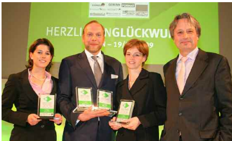
Sal. Oppenheim, Nr. 2 der Gesamtwertung, gewann als einziges Institut drei Einzelwertungen: Kapitalschutz, Discounts und Teilschutzprodukte.