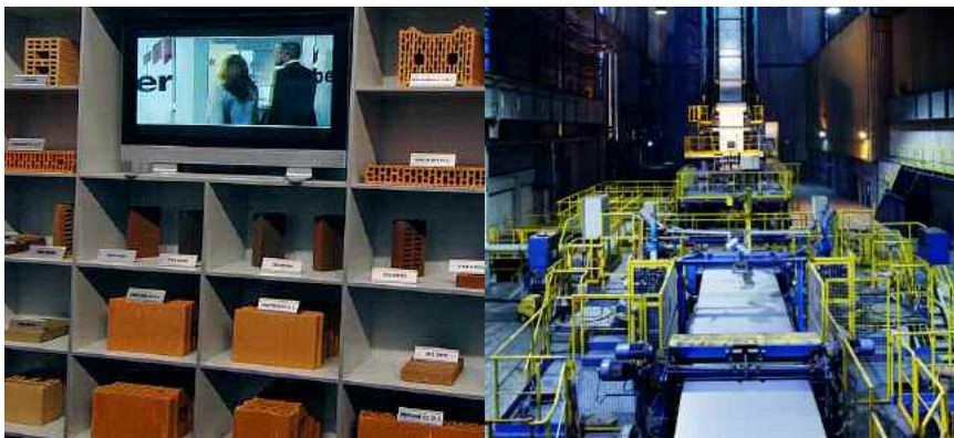
Wienerberger oder voestalpine - wem Fondsmanager ihr Vertrauen schenken

Welchem der beiden Titel - Wienerberger vs. voestalpine - die BE-Leser kurzfristig mehr Potenzial einräumen, das sehen Sie auf http://www.boerse-express.com/betrader