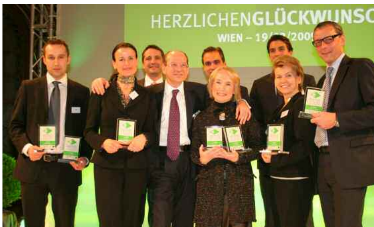
Die RCB holte neben der Gesamtwertung noch die Kategorien „Info&Service“ sowie „Zertifikat des Jahres“. Mit am Bild die gratulierenden Vorstände.