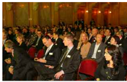
Dutzende weitere Bilder zum Award: www.boerse-express.com/zertifikate