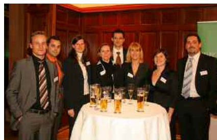
Die richtige Unterlage für fast zwei Stunden Award-Verleihung