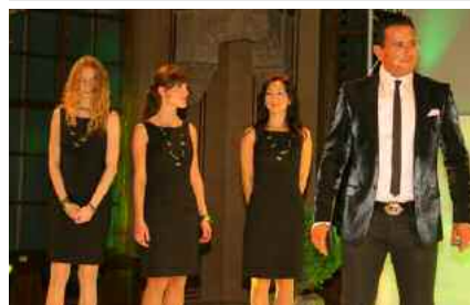
Röhl: Deutsche sagen „Ernst, aber nicht aussichtslos“; Ösis umgekehrt