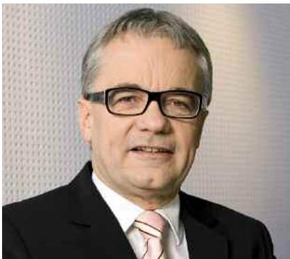
CEO Eder - Timingschwierigkeiten

Heute notieren voestalpine allerdings fernab dieses Kaufpreises bei 9,56 Euro. Das ergibt einen Aufschlag von fast 37% zum aktuellen Aktienkurs der voestalpine oder einen Verlust von knapp 27% für den ersten Kaufkurs.