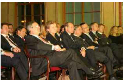
Vorstandsriege in Reihe 1, insgesamt 200 Besucher im Publikum